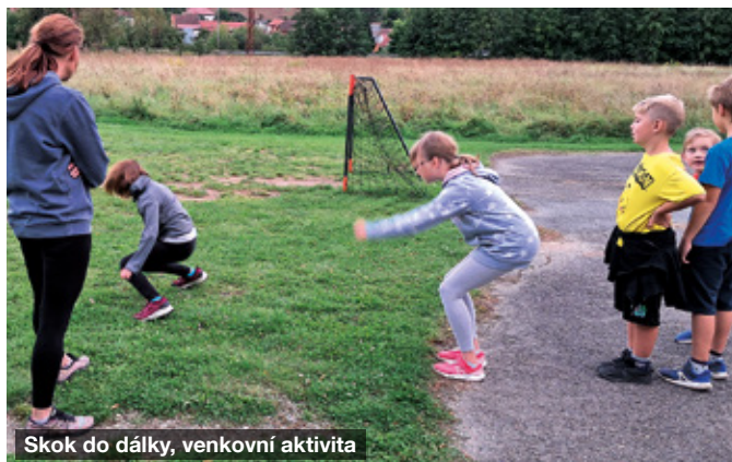
Skok do dálky, venkovní aktivita