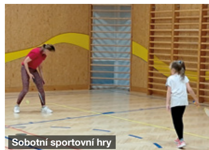
Sobotní sportovní hry