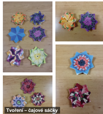
Tvoření – čajové sáčky