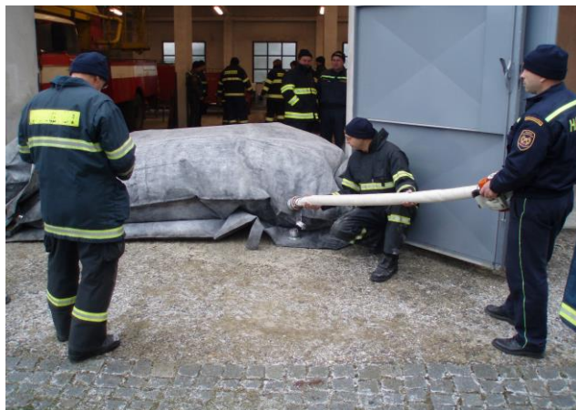
Obrázek 1: Mobilní protipovodňové bariéry